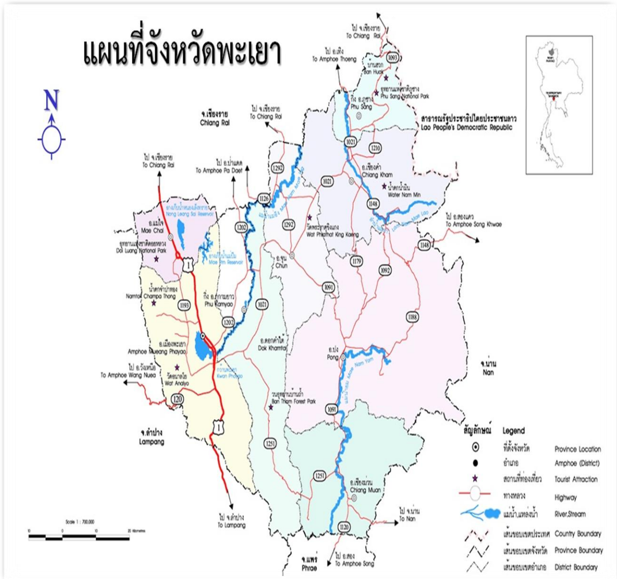
แผนภาพที่ ๑ แผนที่จังหวัดพะเยา