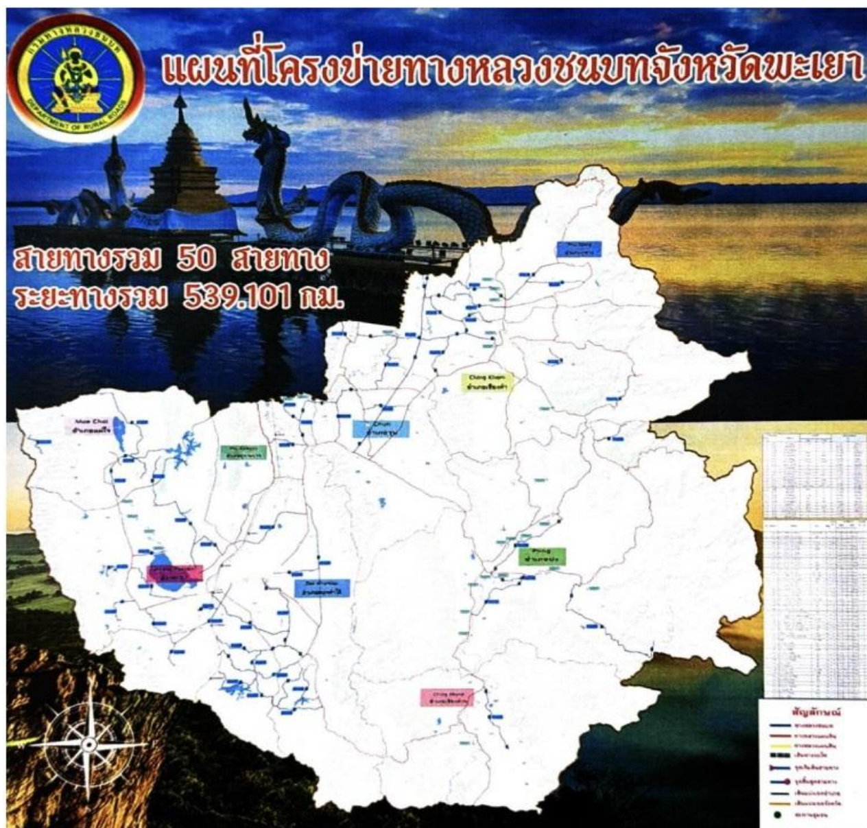
แผนภาพที่ ๔ แผนที่โครงข่ายทางหลวงชนบทพะเยา