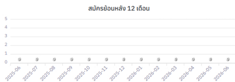
จำนวนการกดเปลี่ยนสถานะ (ไม่มีข้อมูล)

เจ้าหน้าที่ทั้งหมด (คน) 7 สมัครช่วงเวลาี่เลือก 0