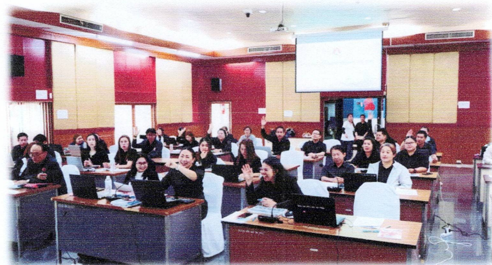
การขับเคลื่อนนโยบาย No Gift Policy ของคณะกรรมการส่วนจังหวัดพะเยา